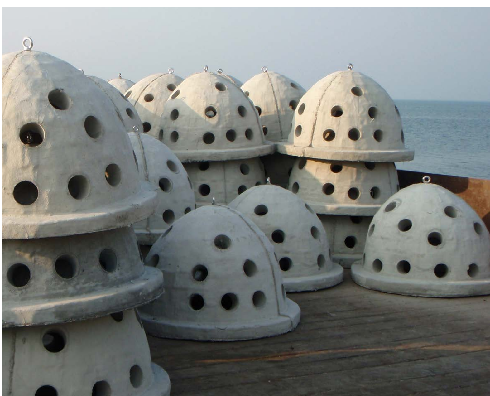
Rifballen boven water